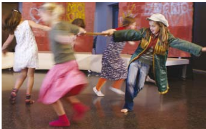
Igra gledališkega naraščaja »Momo« je doživela 14 predstav.