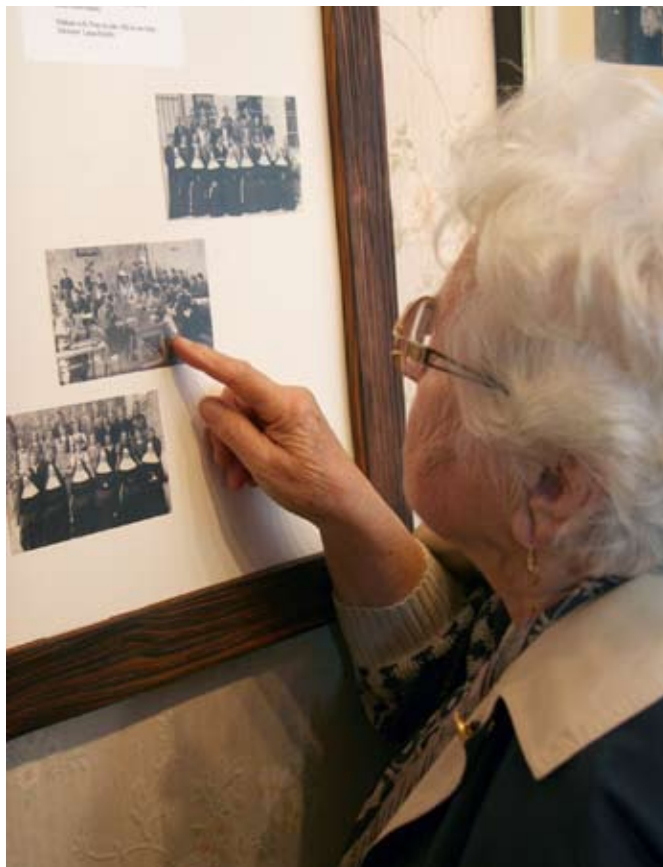
Za zbornik ob 100 letnici šole v Št. Petru je društvo upokoјencev dalo na razpolago slike in dokumente.