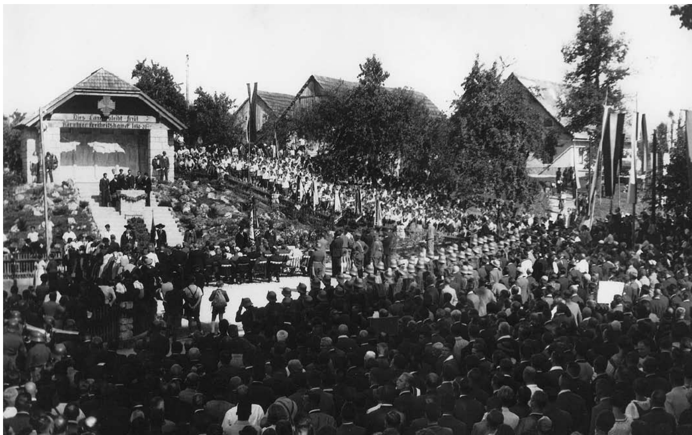
Einweihungsfeier des „Abwehrkämpferdenkmals“ am 5. September 1937