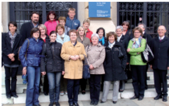
Am 10. 4. 2010 luden die EL-ženske/Frauen Pliberk/Bleiburg zu einem Tag der Kultur nach Ljubljana ein.