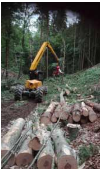
Maschinen sind heute in der Forstwirtschaft nicht mehr wegzudenken.

Gepflegt, gemischt, klimafit und dazu muss man ihn vom Stadium des Jungwuchses weg bewirtschaften und pflegen. Der Laubholzanteil wird in jedem Fall wieder zunehmen, die Fichte wird bis zu einer gewissen Seehöhe stark zurückgedrängt werden und trockenresistentere Baumarten, wie verschiedene Eichenarten, Ahorn, Buche oder Tanne, Douglasie, Kiefer, Lärche werden häufiger auftreten.