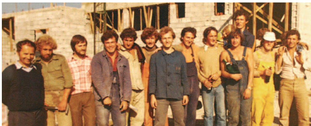
Kulturni dom Danica je nastajal z delom domačinov in prijateljev ter velikim zanosom

ki so skupno sledili eni ideji. Uresničile naj bi se velike sanje malega človeka na Koroškem.