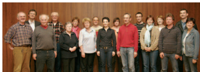
V novem odboru se mlado plodno spaja s starejšim