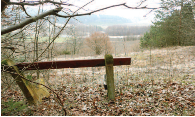
Bankreste mit Blick zum Turnersee- Zablaško jezero

ren Umgebung informieren, sind ein bewährtes Angebot an neue Gästeschichten, die nicht nur baden, sondern gerne und speziell im Frühjahr und Herbst Outdoor-Aktivitäten nachgehen. Solche Stationen werden auch von der einhei-