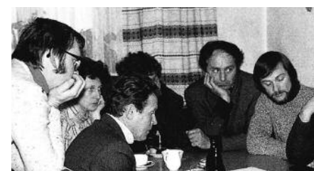
V številnih sestankih so se pripravljali

Der 11. September markiert einen kulturellen Meilenstein in unserer Gemeinde. Am 11. 9. 1978 erfolgte der Spatenstich zum Bau des Kulturhauses in St. Primus. Dieses Haus ist ein Beweis dafür, dass auch die kleinen Menschen, die sonst kaum politisches oder wirtschaftliches Gewicht haben, mit