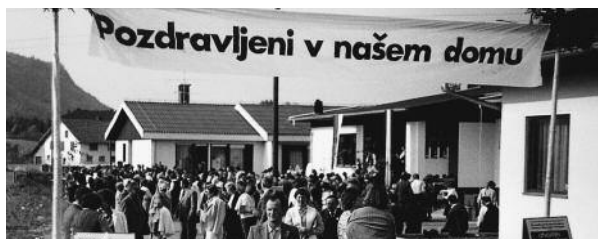
Odprtje Kulturnega doma je bil velik praznik.