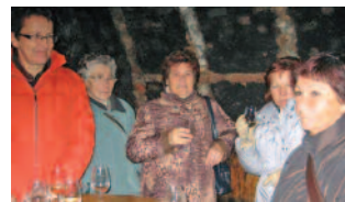
Veseli pri pokušnji papeškega vina v Mariboru

Jeseni so se cerkveni pevci z moškim pevskim zborom Vinko Poljanec podali na skupen izlet v Maribor in si ogledali krasne vinske kraje, seveda tudi vinske kleti. Tam so okusili celo mašno vino, ki ga je menda pil tudi papež Janez Paul II. Z zadovolj-