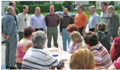
Druženje v Kulturnem domu Šentprimož ob peki na žaru, dobri kapljici in domači pesmi