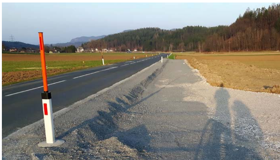
Der erste Teilabschnitt des Radwegs nach Baubeginn / Prvi del kolesarske steze po začetku gradnje

Občina sedaj izvede projekt kolesarske steze Kotmara vas-Celovec (uradni predlog EL iz aprila 2011). Z gradbenimi deli ob deželni cesti v območju odcepa v Šentkandolf / St. Gandolf so še pravočasno konec lanskega leta začeli, da deželne podpore ne bi izgubili. Letos se bo nadaljevalo z odsekom do Trabesinj / Trabesing. Prihodnje leto se bo nadaljevalo z gradnjo do odcepa na Zvonino / Schwanein. Leto navrh naj bi bila vsa dela končana. Kolesarska steza bo šla čez Planino / Alm v Vetrinj / Viktring, kjer se lahko pride npr. preko že obstoječe kolesarske steze RK1 v Celovec / Klagenfurt. Skupni stroški tega projekta so načrtovani z € 800.000 in se krijejo z namenskimi sredstvi (€ 556.000), s posebnimi že prej odobrenimi za kolesarske steze (€ 242.000) in z € 2.000 iz rednega proračuna občine.