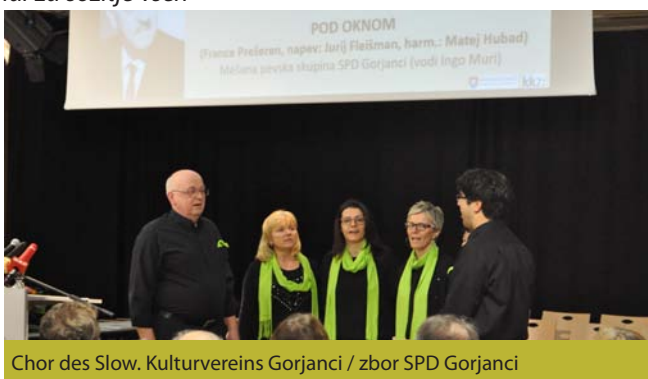
Chor des Slow. Kulturvereins Gorjanci / zbor SPD Gorjanci

dil skupine po večnem mestu Rimu, kar je poleg branja in vnukov njegov priljubljeni konjiček. Po poklicni in tudi (delni) politični upokojitvi je v dejaven predvsem v domači fari, kjer je tudi farni svetnik.