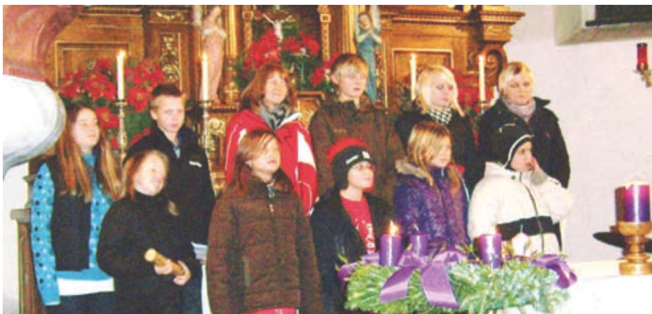
Jugendchor in Windisch Bleiberg / Plajberški mladinski zbor

Der Adventbasar gehört wie das Adventkonzert zur Tradition in der Vorweihnachtszeit. Fleißige Frauenhände haben auch diesmal wunderschöne Weihnachtsdekoration gezaubert.