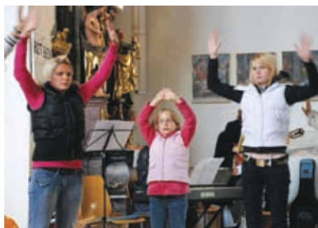
Mladina je sooblikovala bogoslužje

Z izkušnjo tridesetletne dejavnosti na področju varstva okolja je zbrane v veliki dvorani mestne hiše v Borovljah soočil s planetom, »ki ga ljudje ne poznajo tako dobro, kot si mislijo«. Naš svet je planet lakote. 100.000 ljudi na svetu dnevno umre zaradi lakote. Ena milijarda ljudi strada. Za shujševalne kure porabi