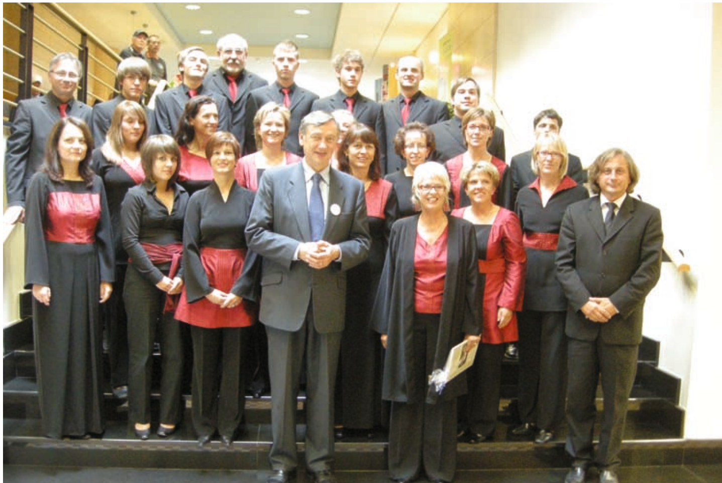
Komorni zbor SPD »Borovlje« v Portorožu skupaj s predsednikom R Slovenije dr. Danilom Türkom → Stran 3 / Seite 3 Der Kammerchor des Slowenischen Kulturvereines »Borovlje« in Potorož mit dem slowenische Staatspräsidenten Dr. Danilo Türk

Nr. / Štev. 2-2008, Erscheinungsort Ferlach, izhaja v Borovljah