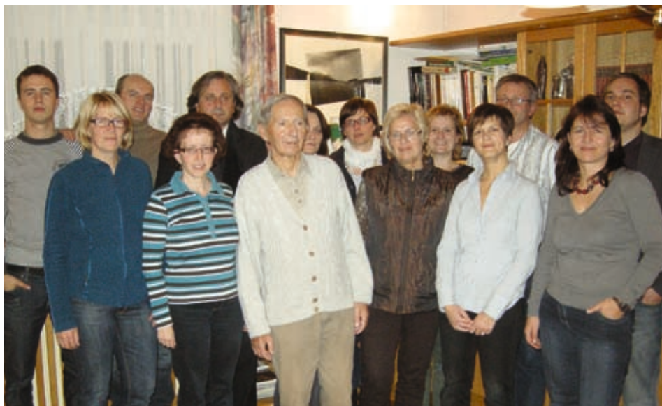
Pevci imajo intenzivne vaje / Die Sänger proben intensiv

K omorni zbor SPD »Borovlje« ima za sabo bogato pevsko sezono, na vidiku pa so že novi nastopi in koncerti.