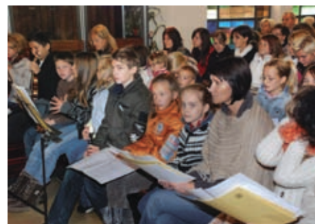
Obiskovalci dekanijskega dneva so se dobro počutili