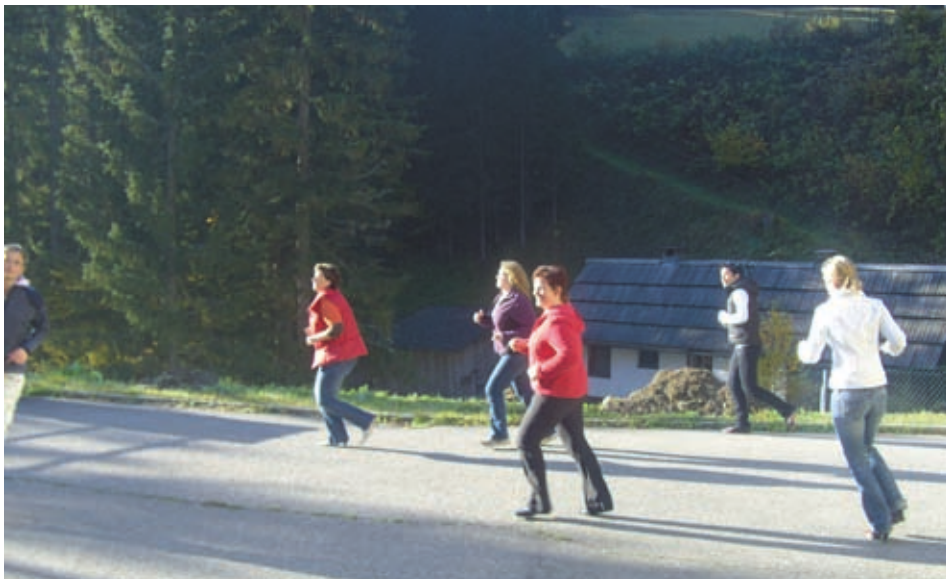
Šport ob pevskem seminarju / Sport und Singen gehören zusammen

Der Start in die neue Singsaison wurde mit einem intensiven Singwochenende am 12. 10. 2008 in der ehemaligen Volksschule in Windisch Bleiberg begonnen. Mit viel Fleiß, Mühe und Engagement wurden viele neue Lieder einstudiert und man bereitete sich auf die nächsten Auftritte vor.