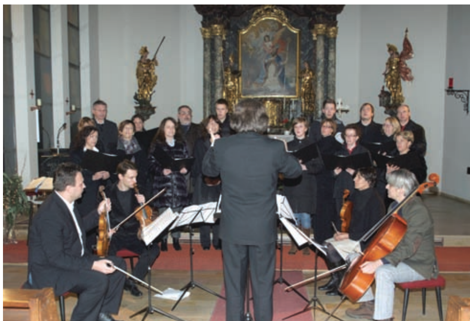
Die slowenischen Philharmoniker aus Ljubljana und Kammerchor SPD »Borovlje« Slovenski filharmoniki iz Ljubljane in Komorni zbor »Borovlje«

Zum alljährlichen Konzert am ersten Adventsonntag haben am 30. November 2008 der Slowenische Kulturverein »Borovlje« und die Pfarre Ferlach in die Pfarrkirche eingeladen. Das erste Adventkonzert in Ferlach war sowohl für das zahlreich erschienene Publikum als auch