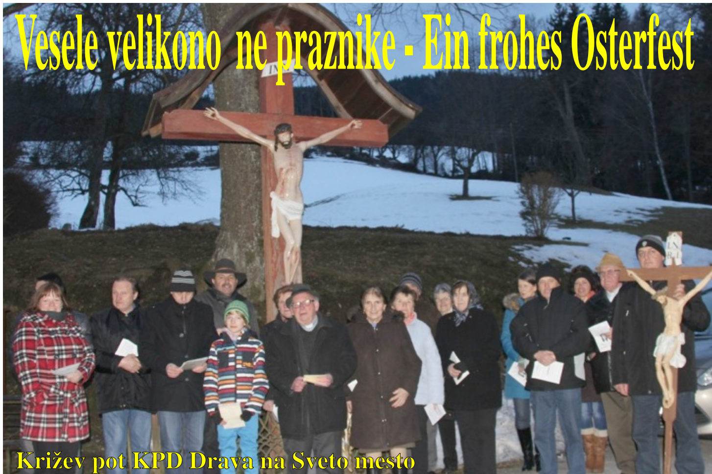
Križev pot KPD Drava na Sveto mesto